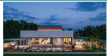
スタディーイメージパース