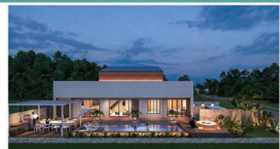
スタディーイメージパース